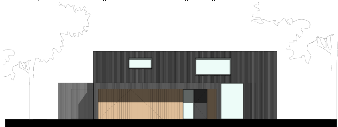
oostgevel B (voorgevel)

Definitief ontwerp van de villa die naast de grond van mevrouw van Vlaardingen wordt gebouwd.